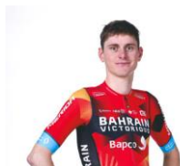
マテイ・モホリッチ選手 脚質:クライマー