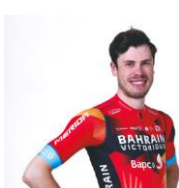
フィル・バウハウス選手 脚質:スプリンター