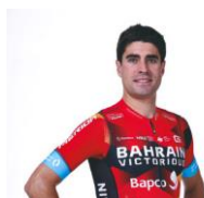
ミケル・ランダ選手 脚質:クライマー