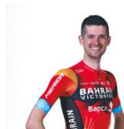
ワウト・プールズ選手 脚質:クライマー