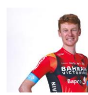
ジャック・ヘイグ選手 脚質:クライマー