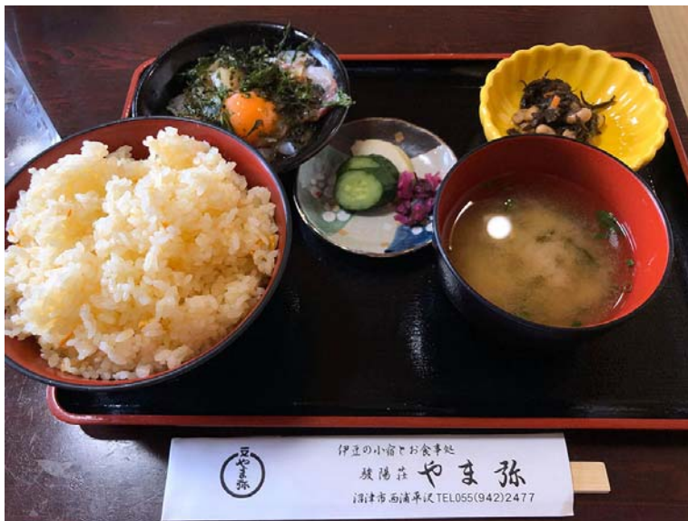
鯛井(駿陽荘やま弥)

昼食は海沿いにある「駿陽荘 やま弥」さんへ。仲買もしている店主さんが厳選した駿河湾の新鮮な真鯛を漬けたお店の名物「鯛井」をいただきます。