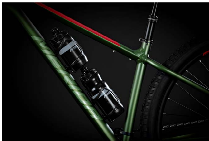
2 箇所のボトルケージ