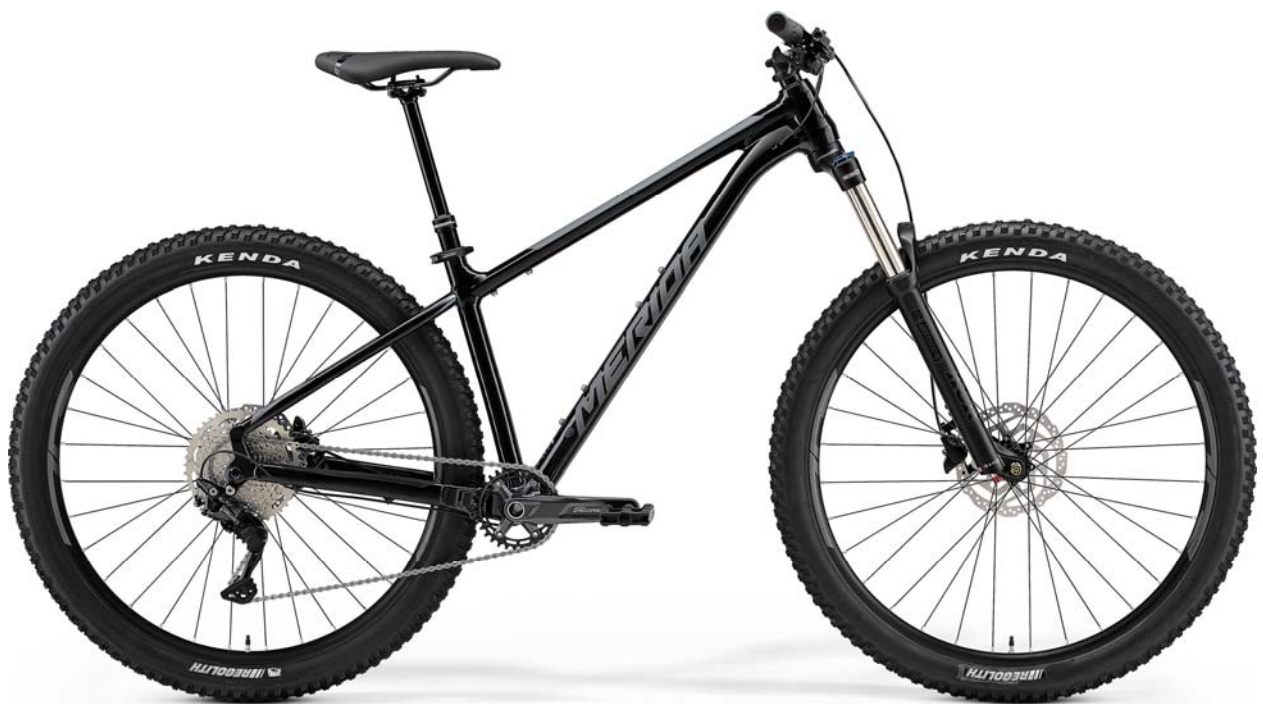
GLOSSY BLACK (MATT COOL GREY) EK93

アルミフレームを採用した BIG. TRAIL は、140mm トラベルのフォーク、アグレッシブなジオメトリー、長めのトラベルのドロPPERポスト、29 インチホイールを採用。タイヤクリアランスは 2.5 インチまで対応しています。