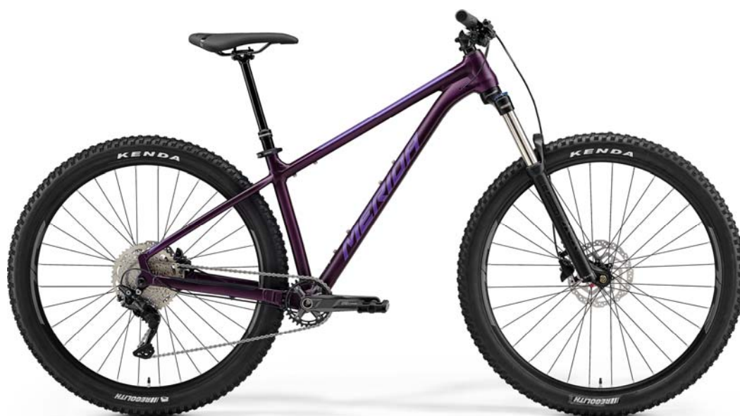
SILK DARK PURPLE (SILVER- PURPLE) EM03

メリダジャパン株式会社(本社:神奈川県川崎市、代表取締役社長:高谷 信一郎)は、日本国内での独占販売権を有するMERIDA(メリダ)から、29erホイールを装備した新世代トレイルバイク「BIG.TRAIL 400」を2021年ラインナップにて、新発売いたします。