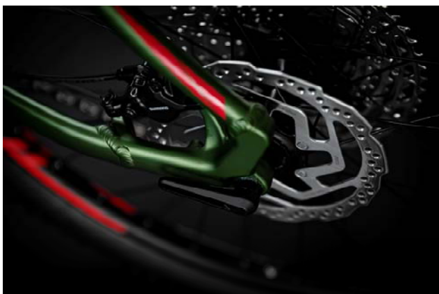
180mm 径のディスクローター

そのほかにも内装式ケーブル、前後 Boost 規格、ねじ切り式ボトムブラケット、Sram UDH ハンガー、内幅 29mm のチューブレスレディールーム、前後 180mm 径のローターも採用。